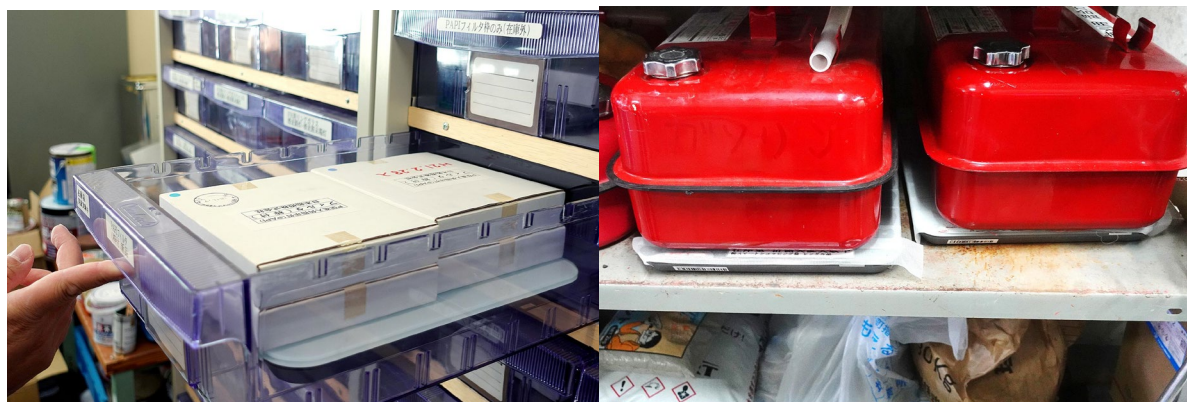
SmartMat Cloud 導入後の在庫棚

本取組を通じて、職員の心的負担を軽くし、真の効率化をもたらす空港 DX を全国の空港に推進していきます。